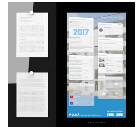
Das puck Board, schematische Darstellung