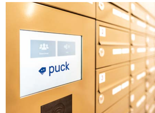
Die puck Box, am Beispiel der Pramergasse 16

puck sorgt dafür, dass man seine Wohnumgebung auf völlig neue Weise kennenlernt: In der App sowie am puck Board werden laufend ausgewählte Veranstaltungs-, Restaurant- und Lokaltipps sowie für die Hausbewohner relevante Informationen und News veröffentlicht. So bleibt jeder am letzten Stand.